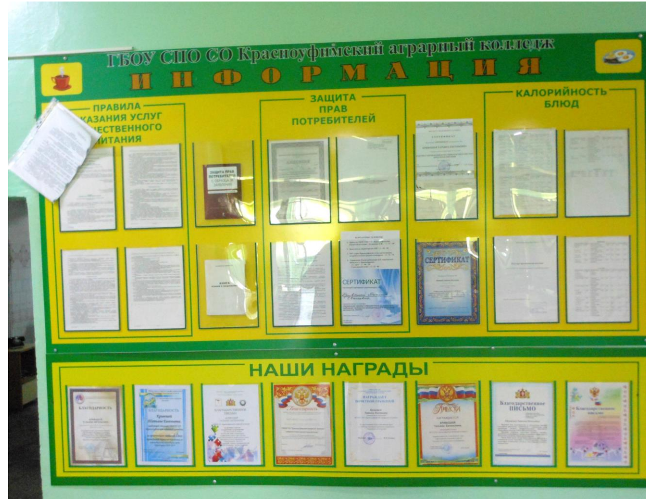
Фото информационного стенда для потребителей с указанием находящейся в нем информации