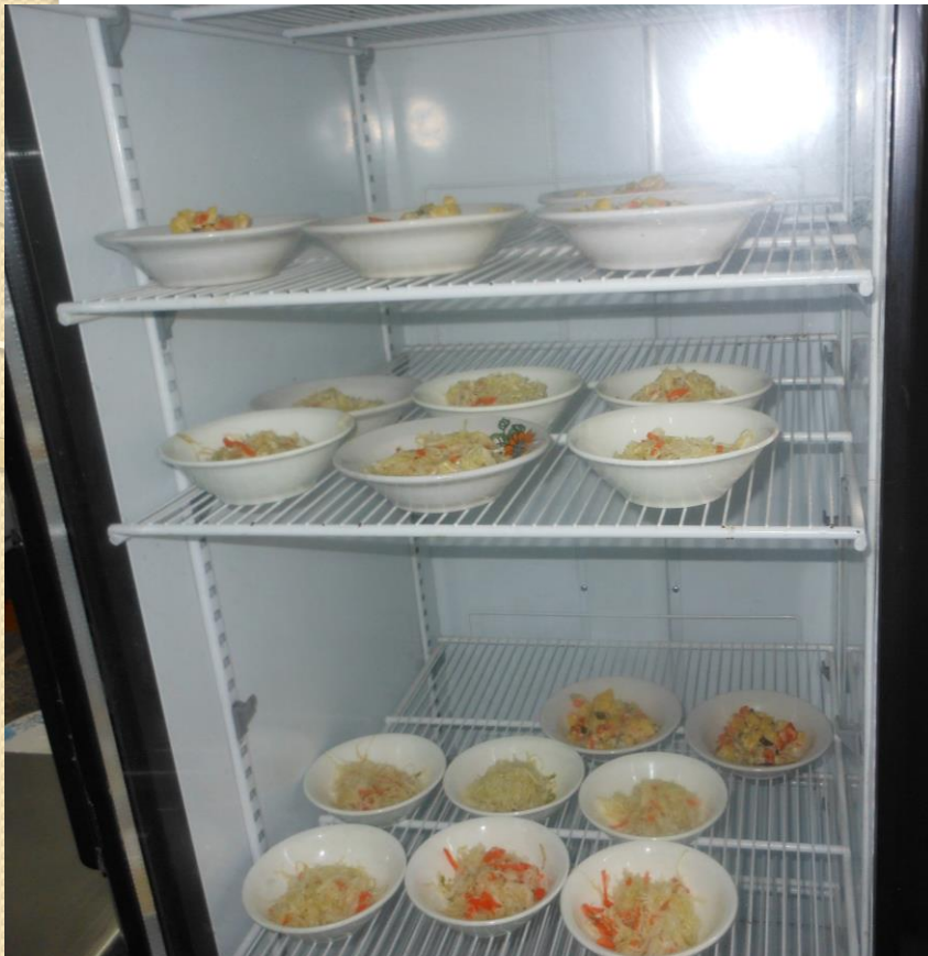
Салаты, холодные закуски