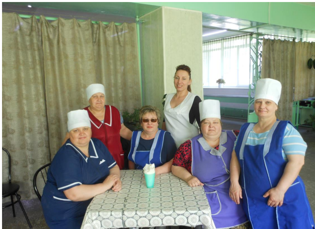
Коллектив столовой и буфета колледжа

Количество прошедших переподготовку – 1 человек