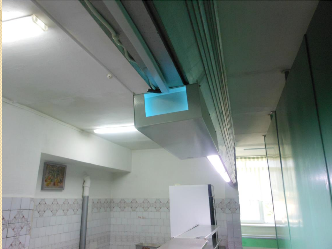
Над линией раздачи