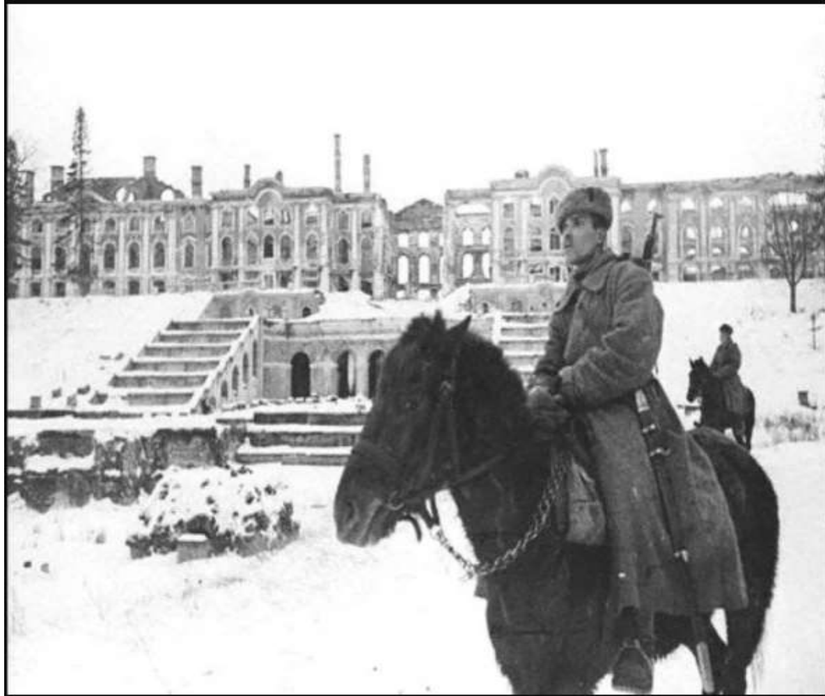
Советский солдат в Петергофе