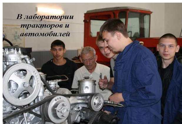
В лаборатории тракторов и автомобилей

«Тракторист машинист», «Водитель категории «А» «В» «С» оборудованы классы, лаборатории, полигон и автодром.