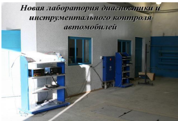
Новая лаборатория диагностики и инструментального контроля автомобилей

По специальностям «Механизация с/х», «Техническое обслуживание и ремонт