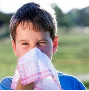
▪ бумажная салфетка