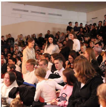
Большой актовый зал и много студентов

А еще студенты 11 К отметили, что в колледже хорошие кабинеты, но правда в них еще холодно, надеемся это временно.