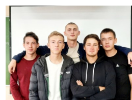
Советы от группы 42 Э

что ты—человек, а не неопознанный проходящий объект» .