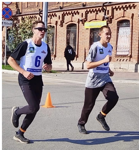
Студенты аграрного колледжа в забеге