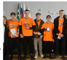
1 место — аграрный колледж

Самые серьёзные представители субъектов профилактики города поделились напутственными словами: о гражданском кодексе, морально-правовом кодексе, административных и уголовных правонарушениях,