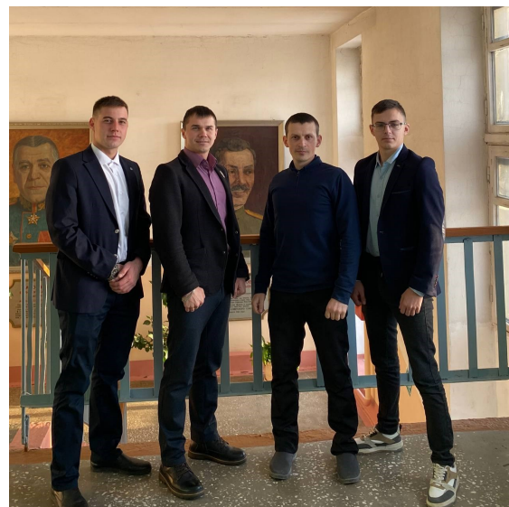
52-Э и преподаватели спецдисциплин