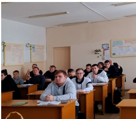
Экзамен в процессе

И вот пришла пора первого экзамена, многие получили «автоматы» так как учились и старались в течение семестра, а те, кто не получили «автомат», теперь пишут экза-