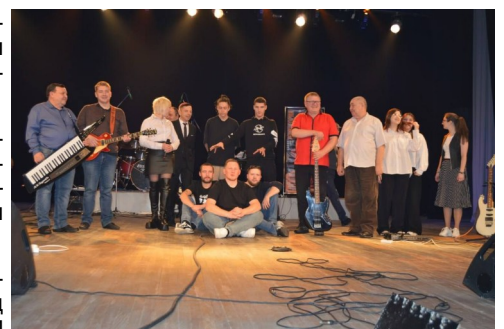
Медиацентр 11 ТО

В данном розыгрыше победителем оказалась группа под названием «Выпускной», с чем мы их поздравляем!