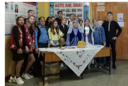
Медиацентр 11 3 Галатюк Е., Феденев К.