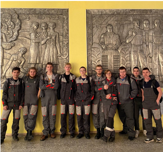
31-Э на практике