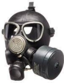
□ изолирующий противогаз